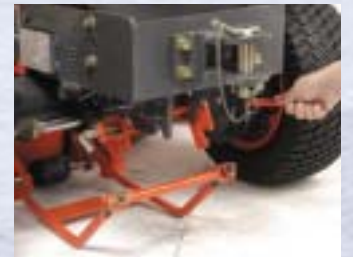
MÉCANISME ATTACHE/DÉTACHE RAPIDE