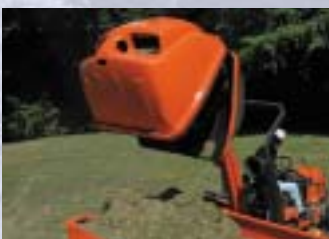
BAC DE RAMAS-SAGE HIGH DUMP