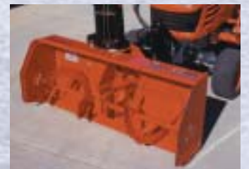
TURBINE À NEIGE