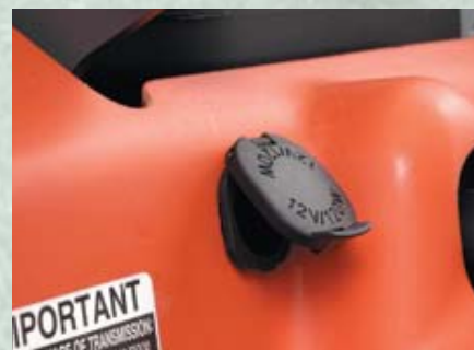
PRISE 12 VOLT