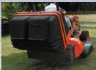
BAC DE RAMAS-SAGE LOW DUMP