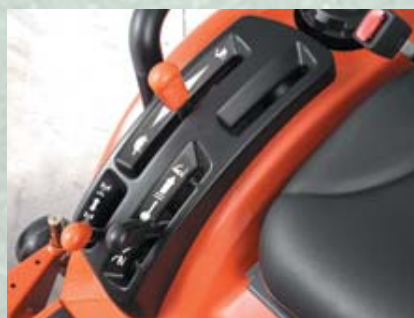
GUIDE LEVIER DE LUXE

Nous avons changé la position de la pédale sur le nouveau BX2350 pour augmenter le confort de l'opérateur. Nous avons séparé les pédales avant et arrière HST et avons déplacé le blocage de différentiel sur le côté arrière du siège. Ces changements procurent à l'opérateur un plus large espace. Elargi de 101,6 mm et rallongé de 50,8 mm, la plateforme offre plus de place aux jambes que les précédents modèles.