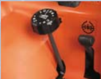
TONDEUSE – AJUSTEMENT DE LA HAUTEUR