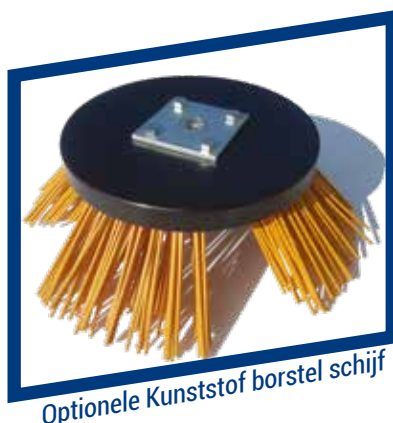
Optionele Kunststof borstel schijf