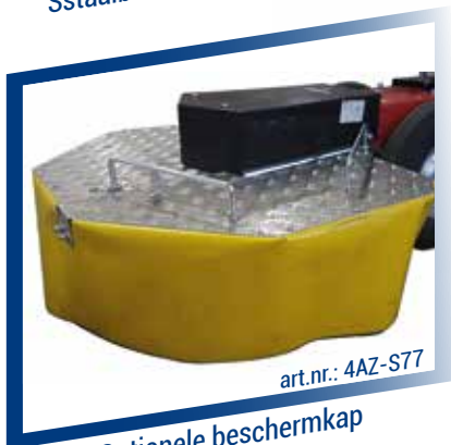
art.nr.: 4AZ-S77 Optionele beschermkap