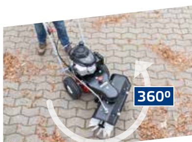
360° WIEL VRIJLOOP