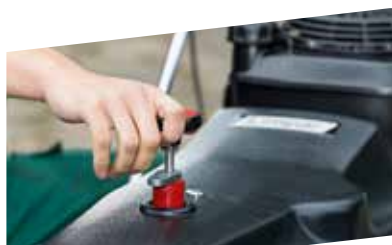
CENTRALE BORSTEL HOOGTE VERSTELLING