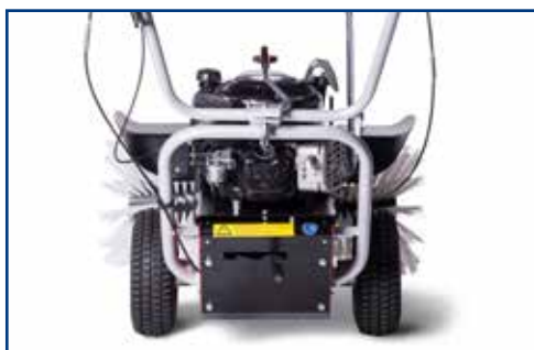
VARIABLE RIJ SNELHEID