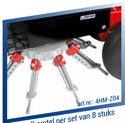
art.nr.: 4HM-Z04 Sstaalborstel per set van 8 stuks