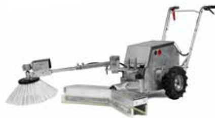
SP-94 INCL. ZIJ-BORSTEL