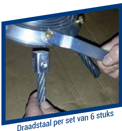
Draadstaal per set van 6 stuks